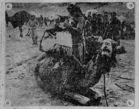
Esta fotografía fue tomada en el Valle del Jordán y muestra a las fuerzas del Imperio Británico de Palestina en uno de sus regimientos de camellos que ahora sin duda entrarán en gran acción si es que los acontecimientos se precipitan como parece y los alemanes llevan su ataque al Cercano Oriente.

No hace muchos años me fulminaban porque yo decía, siendo presidente, que mi deber de gobernante democrático era entregarles el poder a los comunistas si triunfaban en las elecciones.